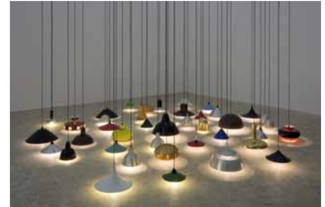
SUBA NOVA 10.07, 2007